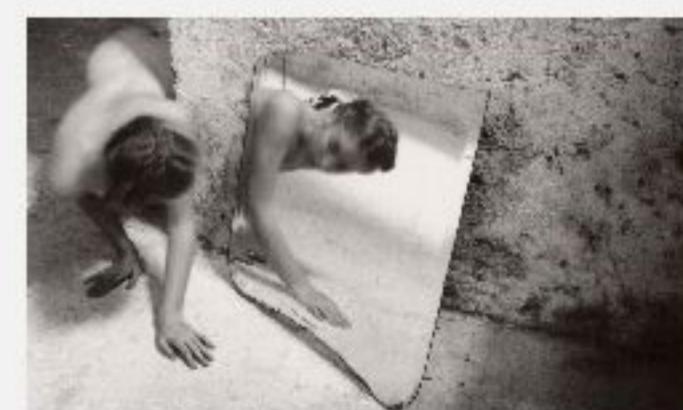
Francesca Woodman © George and Betty Woodman

Inauguration de l'exposition de Francesca Woodman au FOAM